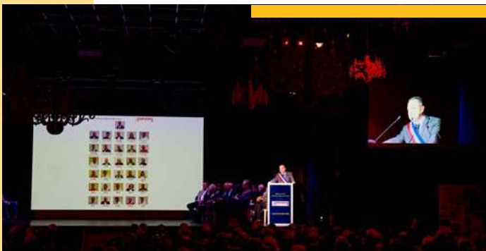
Cérémonie des vœux de Monsieur le Maire à la population.