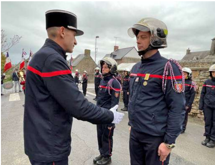
Cérémonie de la Sainte-Barbe du 23 novembre 2024 à Vergoncey

Les JSP jouent un rôle crucial dans la transmission des valeurs des sapeurs-pompiers, telles que l'altruisme, le courage et la solidarité.