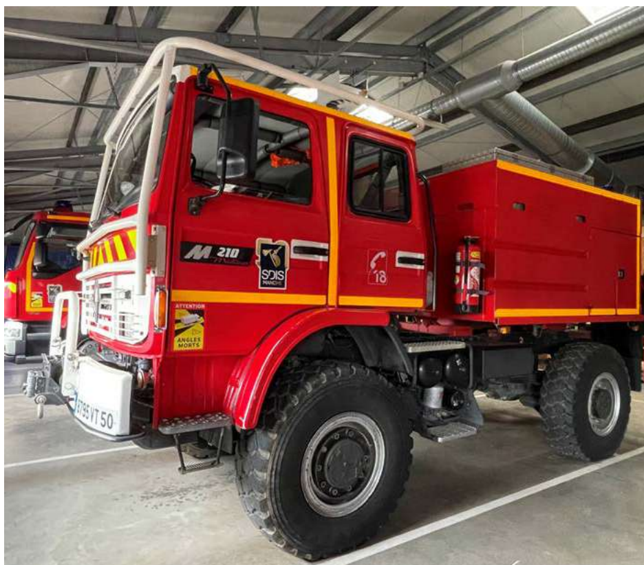
Le camion-citerne flambant neuf feux de forêt (CCF) ayant servi le 1 er avril dernier pour un feu sous une ligne de 20 000 volts qui s'était propagé à un champ à Isigny-Le-Buat.

Les sapeurs doivent suivre des formations obligatoires dont 15 heures annuelles (secours, feu, équipement, sport). « Cela permet de s'assurer que tous les pompiers restent à jour sur les procédures, les techniques et les équipements », note Franck TREHET, chef du centre de Saint-James. « Des formations supplémentaires peuvent être proposées pour des compétences spécifiques ou des mises à jour sur les nouvelles réglementations ».