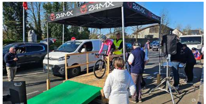
Le Tour des Granitiers a fait étape à Saint-James en avril dernier.