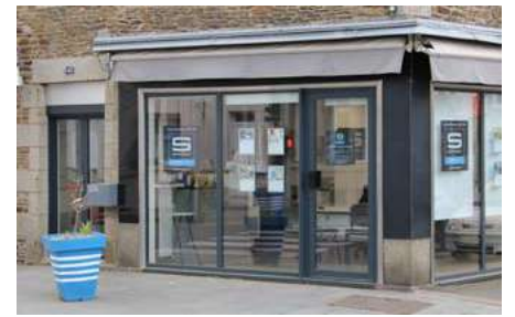
Samsic agence d'intérim

L'agence, ouverte en février dernier en lieu et place du salon de tatouage, propose une gamme complète de services dans divers secteurs, tels que l'hôtellerie, l'industrie, la restauration, le maraichage, le bâtiment... pour des postes en intérim, CDD ou CDI. La sélection des candidats se fait sur les compétences, le savoir-faire et le savoir-être. L'agence fait par ailleurs passer des tests et organise des entretiens individuels.