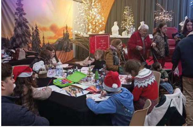
Marché de Noël Le traditionnel Marché de Noël, en décembre 2024, organisé par l'UCIA.