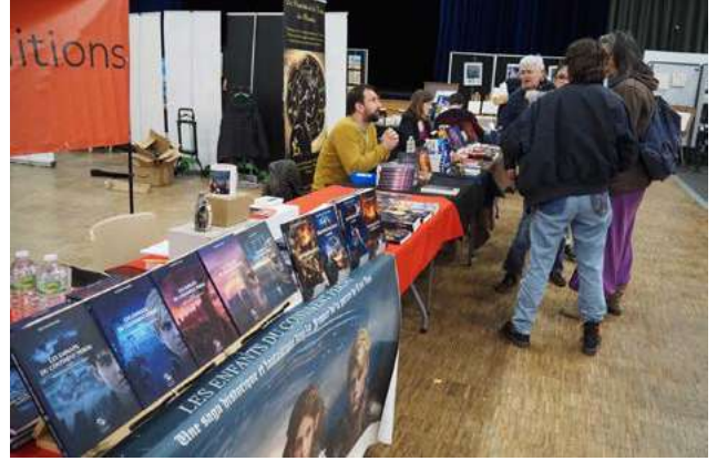
Le 5 e Salon du livre a eu lieu le 30 mars à l'ELC.