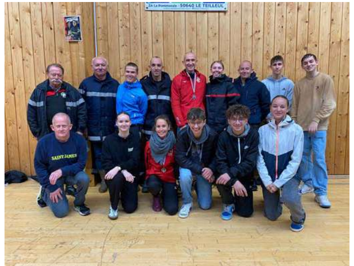
Formation aux gestes des premiers secours auprès des jeunes du centre de loisirs