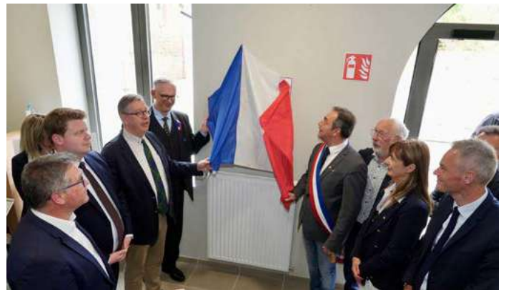
L'inauguration de la Maison des Citoyens a eu lieu le vendredi 25 avril.

Pour mieux répondre aux besoins et contraintes des habitants, les horaires d'ouverture ont été ajustés : plages de fermeture réduites sur le temps du midi, fermeture décalée de 30 minutes le mercredi soir et maintien de l'ouverture le samedi matin. Au total, l'amplitude horaire s'est élargie de six heures par rapport aux anciens horaires d'accueil à l'Hôtel de Ville.