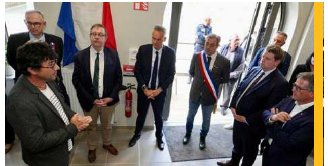
La journée du 25 avril a été consacrée en partie à plusieurs inaugurations sur Saint-James La Maison des Citoyens et le France Services, l'éclairage public et les travaux d'aménagement du bourg de Carnet.