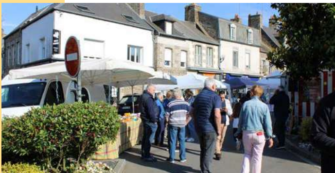
Marchés nocturnes. Le 23 mai a eu lieu le premier marché nocturne de l'année, regroupant 28 exposants autour de produits du terroir et de l'artisanat avec un concert de l'Ecole des Arts de Saint-James et de l'Ensemble Instrumental de Pontorson.