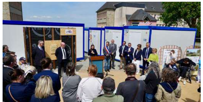
Maison d'Accueil Spécialisée Pose de la première pierre le 25 avril dernier.