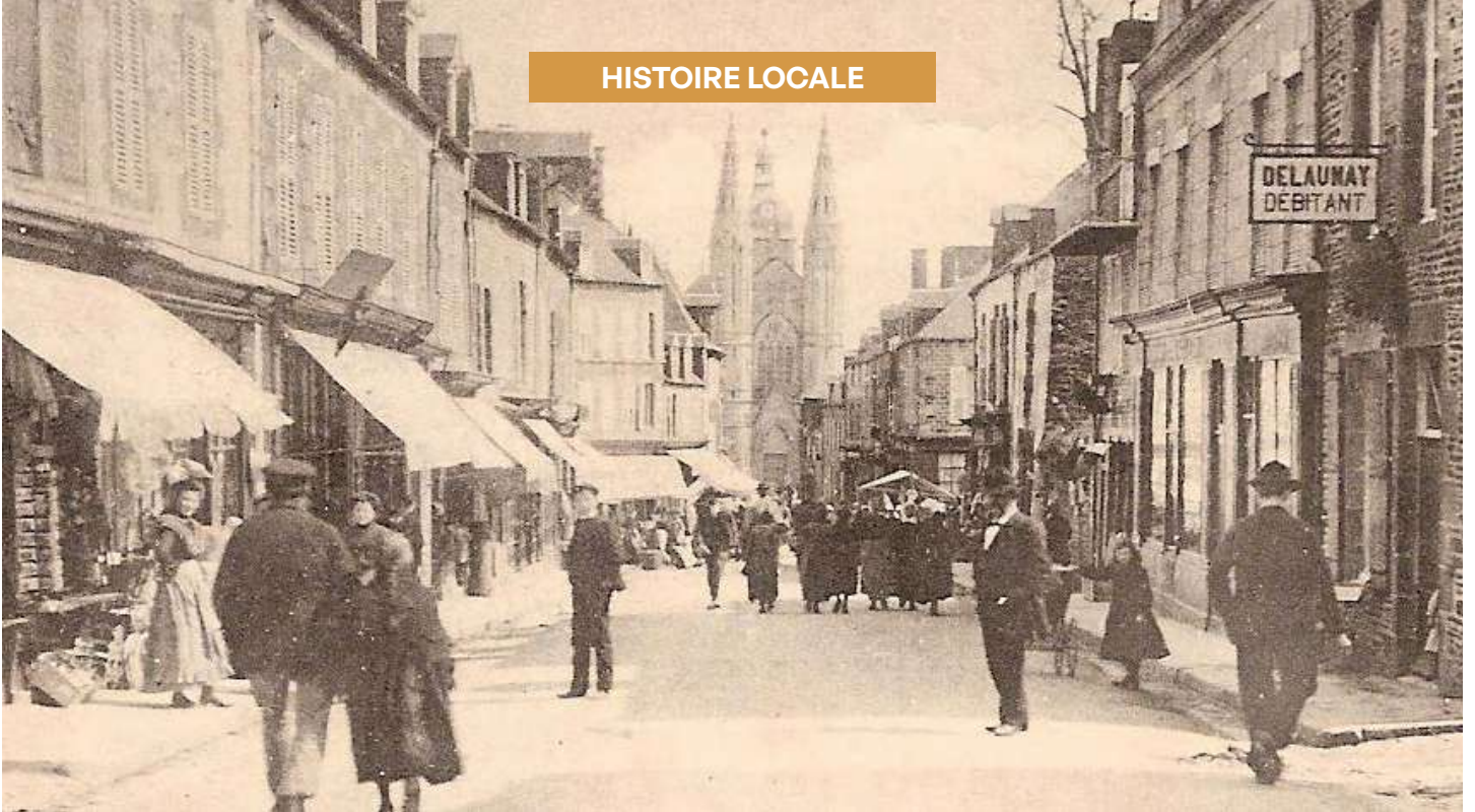
La rue Fauconnière, créée par Eugène Surseois en 1828